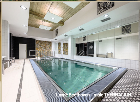
Lázně Beethoven - malé THERMALIUM