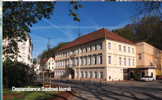
Depandance Sadové lázně