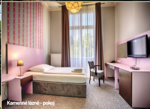
Kamenné lázně - pokoj