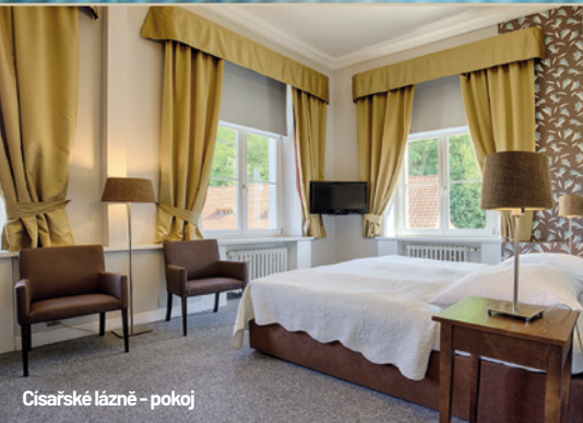
Císařské lázně - pokoj