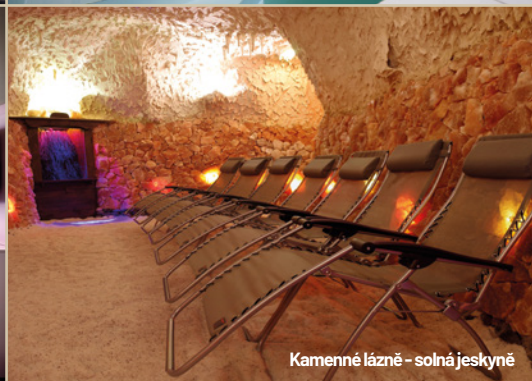
Kamenné lázně - solná jeskyně