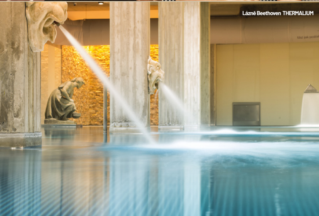
Lázně Beethoven THERMALIUM