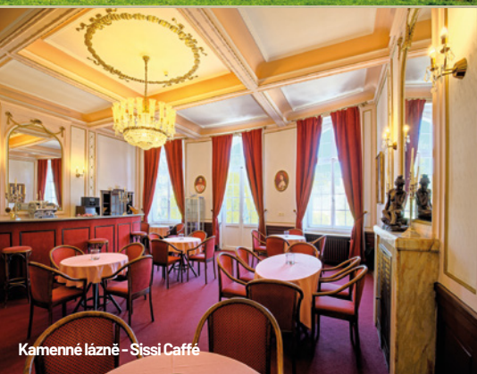
Kamenné lázně - Sissi Caffé